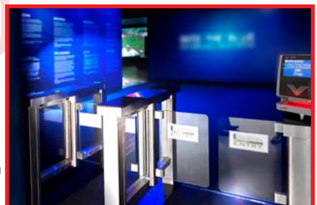
EG-SR Pasillo con hojas de cristal.

* Las especificaciones están sujetas a cambios sin previo aviso.