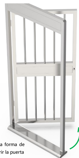
Una forma de abrir la puerta